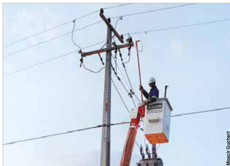
Copel restabeleceu completamente o sistema elétrico apenas na madrugada.

No bairro do Jardim Cristine, os problemas foram ocasionados pelo rompimento de um cruzamento aéreo da rede elétrica, um jumper rompido e galhos de árvores lançados sobre os cabos, ocasionando a interrupção do fornecimento de energia elétrica.