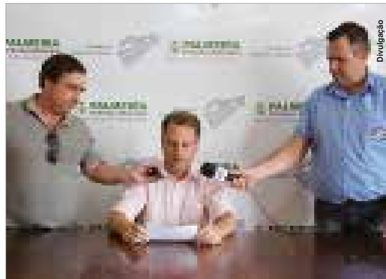
Prefeito fez anúncio da decisão em entrevista coletiva no dia 24.

Informação da diretoria da concessionária dá conta que os estudos e negociações junto ao DER para a construção do viaduto estão adiantados. Entretanto, nem Prefeitura nem Caminhos do Paraná arriscam estabelecer pra-