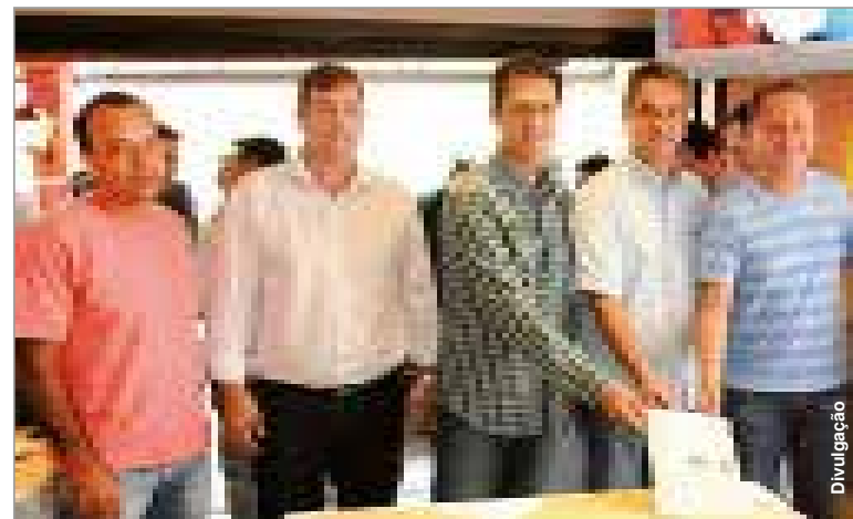
Assinatura: prefeito e comitiva de Palmeira com o deputado Plauto.

Os recursos a serem destinados à Prefeitura de Palmeira são alocados no Programa de Apoio à Aquisição de Máquinas e Equipamentos Rodoviários para as Prefeituras (PROMAP). As regras deste programa exigem que o município ofereça contrapartida financeira, com valor referente a 10% do que é repassado pela SEDU. Assim, a Prefeitura deve desem-