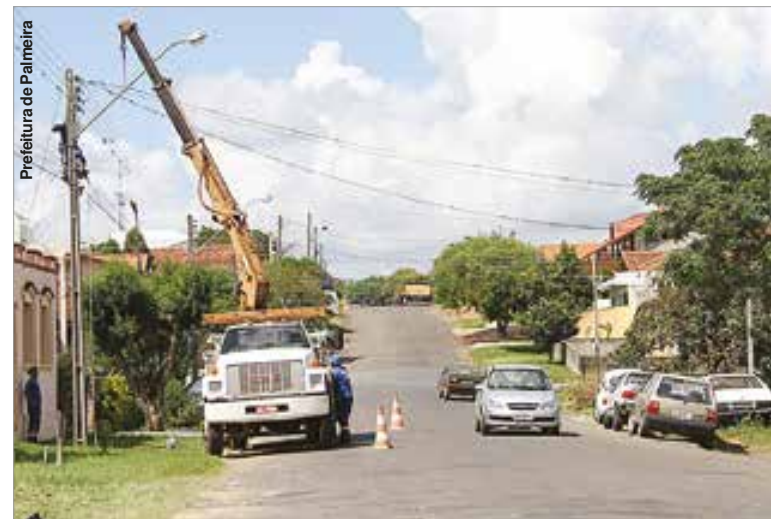
Iluminação da rua Coronel Ottoni Ferreira Maciel recebeu melhorias.

Enquanto três ruas receberam melhorias, moradores relatam o descontentamento em outros locais da cidade, através de redes sociais. Depoimentos citam a es-