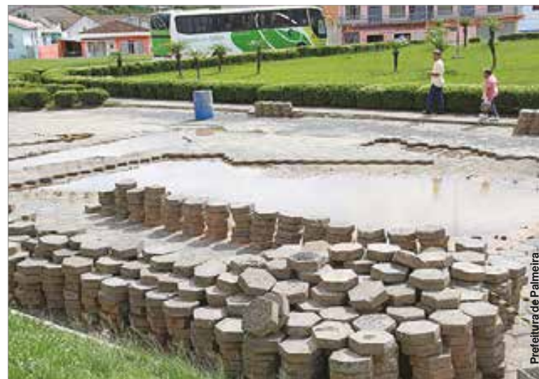
Pavimento foi retirado para receber obra de nivelamento.

A obra está sendo realizada com recursos próprios do município e a previsão para conclusão é de cinco dias.