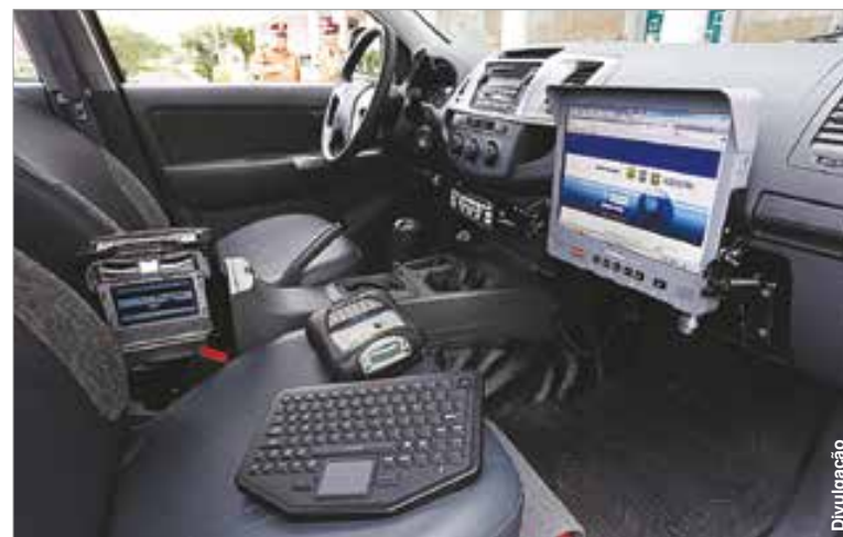
Interior dos novos veículos recebidos pela Polícia Rodoviária.

Cada caminhonete possui um 'toughbook' acoplado a tela em LCD de alta resistência de 15 polegadas e teclado com rápido acesso, além de um conjunto de sinalizadores e rádio de comunicações de última geração.