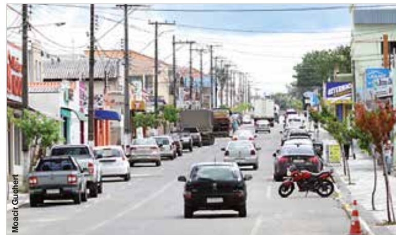
Aumento constante da frota enche ruas da cidade com mais veículos.

1.267 unidades e os reboques e semi-reboques chegam a 642 unidades emplacadas em Palmeira. Já os ônibus e micro-ônibus são 126 unidades. O restante da frota do município é formado por outros tipos de veículos.