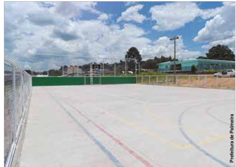
Prefeitura de Palmeira

As obras foram viabilizadas através da união de recursos do governo federal, que através do Programa Esporte e Lazer na Ci-