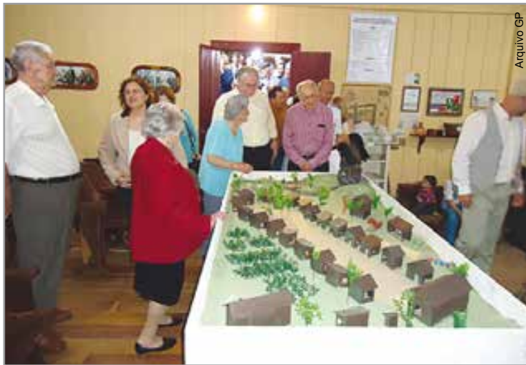
Participantes visitarão o Memorial da Colônia Cecília durante o Simpósio.