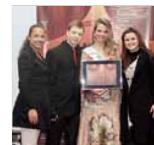
D' Bug Provedor de internet