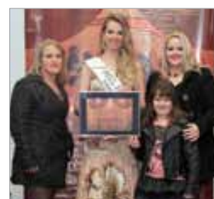
Super Ótica Ótica do ano