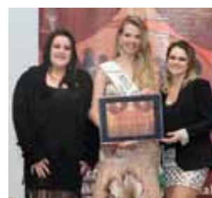
Sempre Bela Cosmético Loja de cosméticos do ano