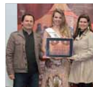
Farmácia Conceição Farmácia do ano