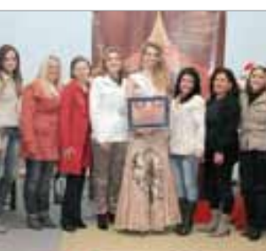
Escola Realeza Pré Escola