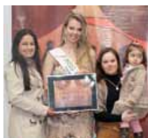
Revitali Clínica de Fisioterapia