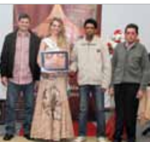
Narf Com. de rações e contrados