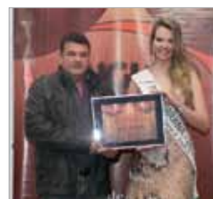
Bolinha Buffet do ano