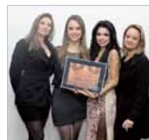
Cabelo e Cia Salão de Beleza