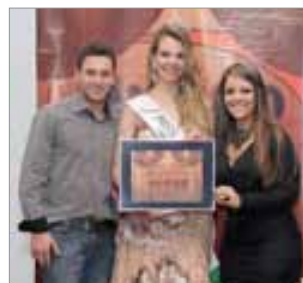
Outlet Com. de produtos importados