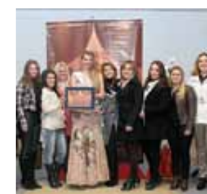
Escola Realeza Ensino Fundamental I e II