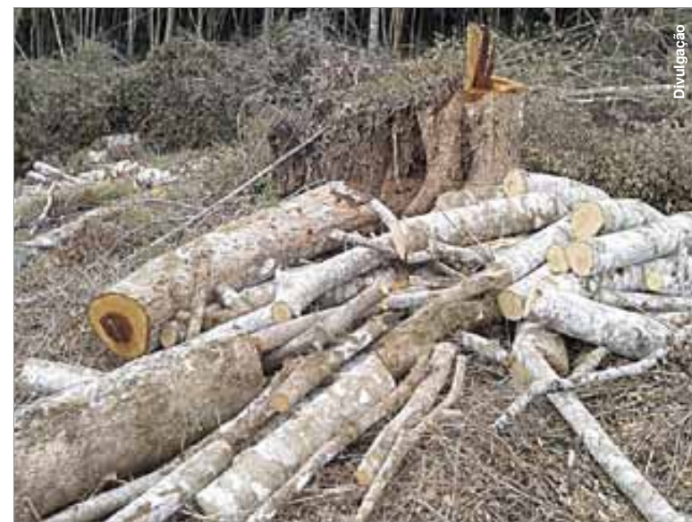
Crime pode render detenção de um a três anos e multa.

ambientais na região dos Campos Gerais podem ser realizadas em áreas de preservação permanente, são de detenção de um a três anos e multa.