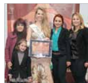
Tika Acessórios e Bijouterias Com. de acessórios e bijouterias