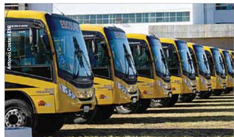
Além de Palmeira, mais 39 APAEs de outros municípios receberam ônibus.

A Assembleia Legislativa é parceira nessa iniciativa. Do dinheiro economizado com as novas medidas da administração, R$ 10 milhões foram repassados à Secretaria de Educação para a aquisição