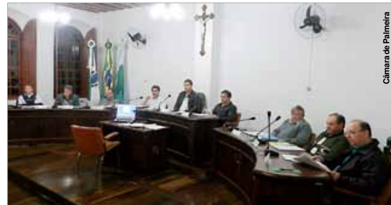
Vereadores votaram apenas um requerimento na sessão de terça-feira.

Com o prazo já vencido, o Executivo depende da LDO, assim como do Plano Plurianual (PPA) para fazer a Lei Orçamentária Anual, a qual deve ser aprovada até o final deste ano. O Legislativo aguarda que seja protocolado novamente o projeto da LDO para que seja então analisado pelos vereadores.