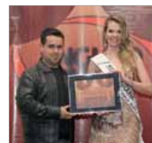
Campneus - Com. de pneus novos, usados e rodas esportivas