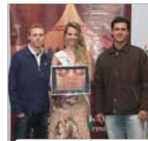
Narf Com. de produtos veterinários