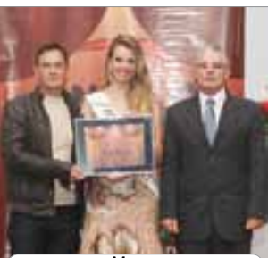
Mance Panificadora e confeitaria do ano