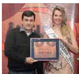
Disk Fácil Lista Telefônica