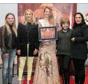
Auto Escola Vila Velha Auto Escola do ano