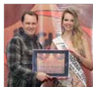
Edir Havrechaki Administração Positiva