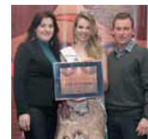
Casa Schamne Loja de caça, pesca e camping