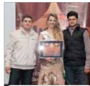
Narf Clínica Veterinária