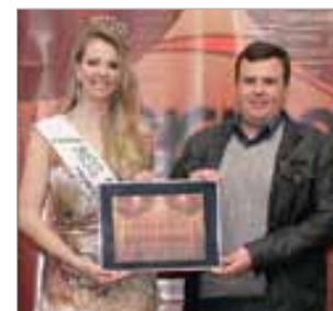
Rádio Ipiranga Rádio AM mais ouvida