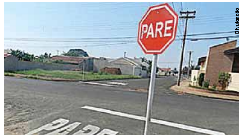
Dinheiro será investido na sinalização vertical e horizontal das ruas.

Para auxiliar os prefeitos e suas equipes neste sentido, o Detran-PR propõe um convênio em que fornece o desenvolvimento de projetos e suporte técnico