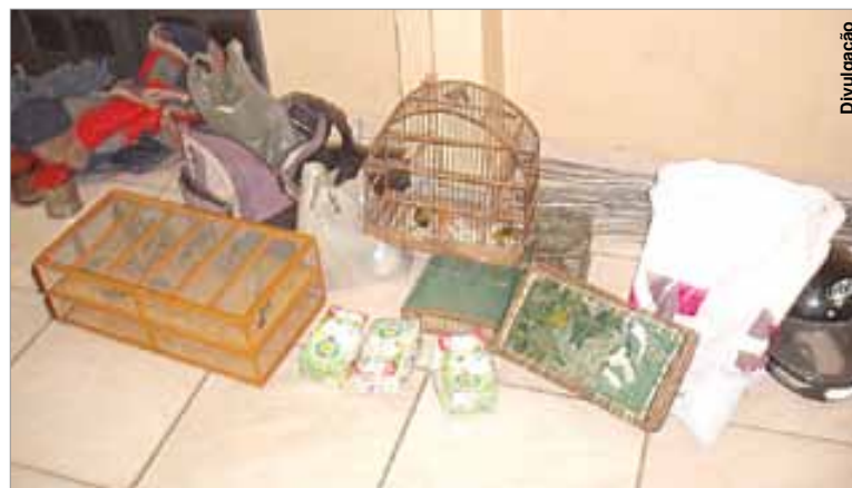
29 pássaros silvestres estavam sob posse dos caçadores.

No bairro Cara-Cara os policiais realizaram cerco e a motocicleta veio a tombar, sendo realizada a detenção de B.A.P., de 22 anos, e D. G., 35. Eles estavam de posse de 15 pássaros silvestres, sendo 10 pintassilgos, três trincas-ferros e dois canários da terra, acondicionados em caixas de longa vida e uma caixa de transporte, caracterizando maus tratos. Tam-