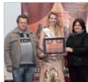
Palmeira Publicidade Ag. propaganda e som volante