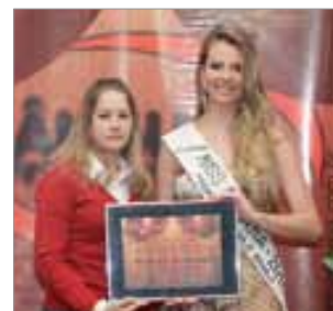
Palmcell Celulares - Revenda de acessórios e assist. técnica