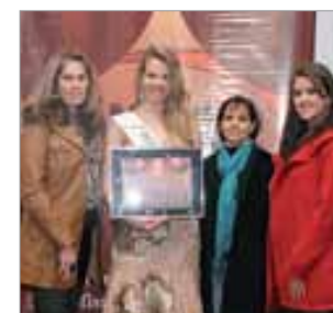
Anasele Multimarcas Loja de moda jovem