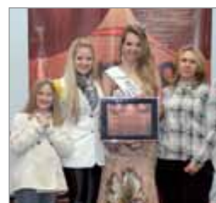
Codec - Clínica Odontológica Ortodontia e Periodontia