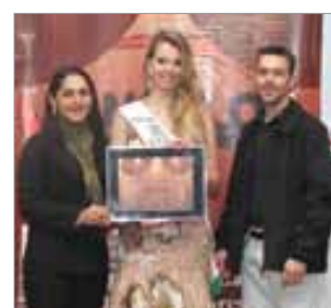
IDEAL Escritório de Contabilidade