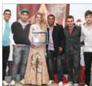
Grupo É sempre Assim Banda musical do ano