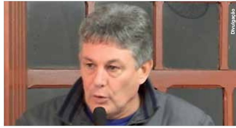
Vereador do PDT cobrou providências da Câmara contra o decreto.