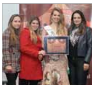
Clikolor Foto e estúdio fotográfico

Também foram agraciados, mas não participaram do evento de premiação da Ângulo Pesquisas no último dia 15/08/2013.