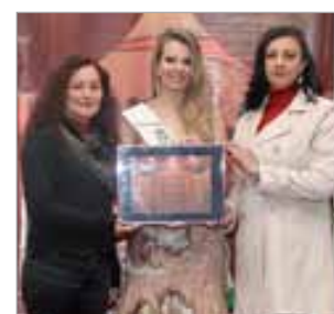
CEDAG - Colégio Estadual Ensino Fund., Médio, Normal e Profissional