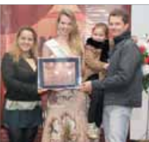
Absoluta Churrascaria do ano