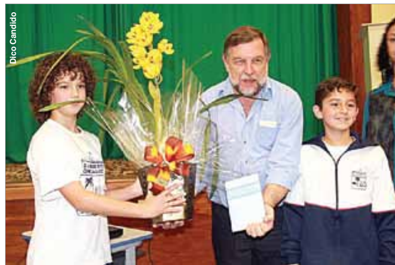
Alunos do CEDAG entregaram lembranças ao secretário e vice-governador.