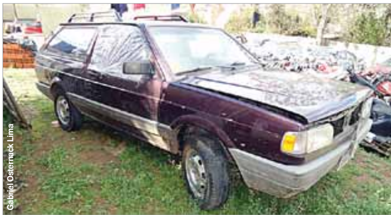
Veículo foi furtado no último dia 3, na avenida Sete de Abril.

No local os policiais constataram que a Parati estava com alguns vidros quebrados, sem rodas e o motor também havia sido retirado pelos criminosos. O veículo, placas GEN-1011, havia sido furtado no último dia 3, na avenida Sete de Abril.