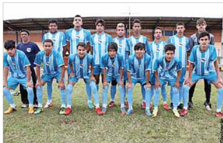
Atletas de uma das categorias da escolinha de futebol receberam uniformes.

“Estamos trabalhando para que Palmeira seja novamente respeitada nas competições esportivas fora do município. Mês após mês temos trazido melhores condições para a prática es-