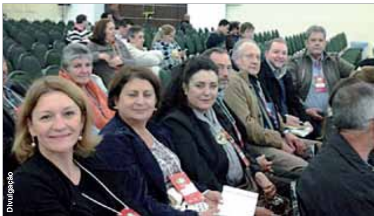
Representantes do município em atividade da conferência estadual.

Mais de 2.500 pessoas, incluindo a comitiva de representantes do município de Palmeira, participaram na quarta (14) e quinta-feira (15), em Foz do Iguaçu, da 5ª Conferência Estadual das Cidades, que discutiu as propostas do Paraná para a Política Urbana e para o Sistema Nacional de Desenvolvimento Urbano. Participam dos debates prefeitos, vereadores, deputados, representantes do Poder Judiciário, do Ministério Público, do Conselho Nacional das Cidades (Concidades) e da sociedade civil organizada. As contribuições do Estado serão levadas à Conferência Nacional das Cidades, que acontece em novembro, em Brasília.