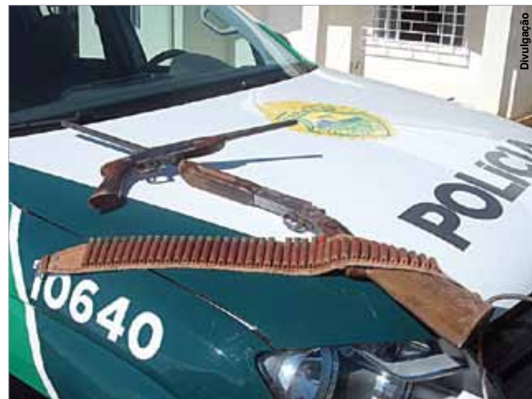
Espingarda e pistolão que estava com numeração raspada eram ilegais.

Na busca domiciliar foram encontradas uma espingarda marca Rossi, calibre 36, um pistolão marca Boito, calibre 36, com numeração raspada, e um cinturão contendo 23 cartuchos intactos e seis deflagrados. Diante do fato, J.B.S. recebeu voz de prisão e encaminhado para a 40ª Delegacia de Palmeira, onde foi lavrado o flagrante. A pena por posse de arma