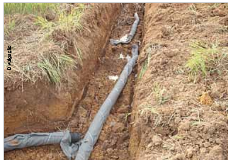
Funcionários de fazenda realizavam drenagem irregular.

O Batalhão de Polícia Ambiental, através do Posto de Polícia Ambiental de Vila Velha realiza diversas ações de prevenção e combate aos crimes ambientais na região dos Campos Gerais. Denúncias sobre crimes ambientais podem ser realizadas através dos telefones (42) 3228-1581 ou pelo email bpambfv-vilavelha@pm.pr.gov.br .