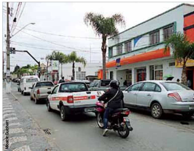
Aumento da frota traz dificuldades para o trânsito nas ruas centrais.

Os dados estatísticos do mês de julho do Detran-PR mostram que este ano, apenas nos sete primeiros meses, a frota de Palmeira foi acrescida de 734 veículos, o que dá uma média mensal de pouco mais de 100 novos veículos registrados a cada mês. A continuar neste ritmo o número de registros de veículos, até o final