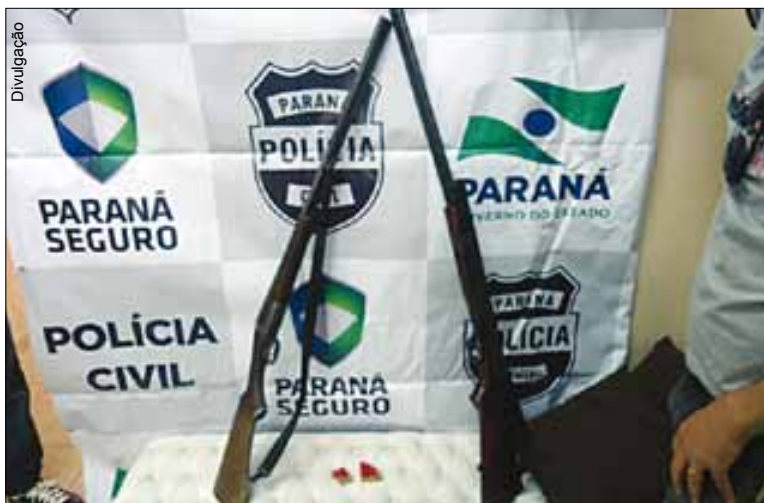
Espingardas apreendidas foram encaminhadas à 40ª Delegacia de Palmeira.